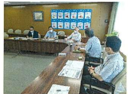
富士市農業委員会