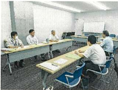
焼津市農業委員会