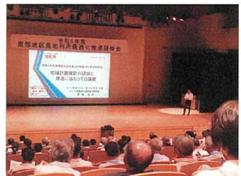
東部地区研修会の様子