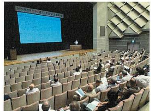
賀茂地区研修会の様子

参加者からは、「講演が分かりやすく、今後の活動に活かせる内容だった」「地域計画の策定にあたり、バックキャストिंगを取り入れてみたい」など、前向きな感想が数多く寄せられた。