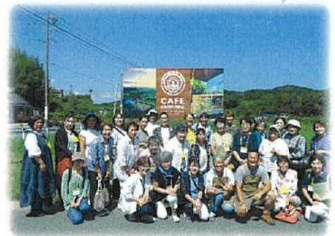
参加した女性農業委員・推進委員