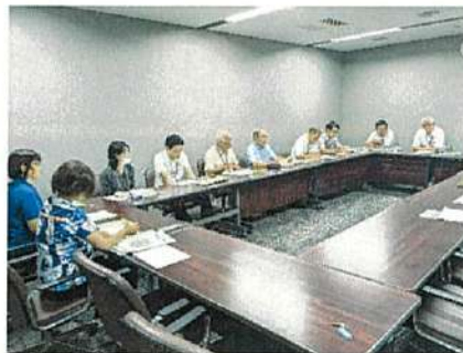
島田市農業委員会